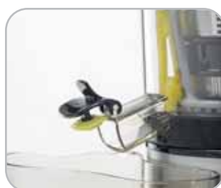
Tappo salvagoccia. Drip cap