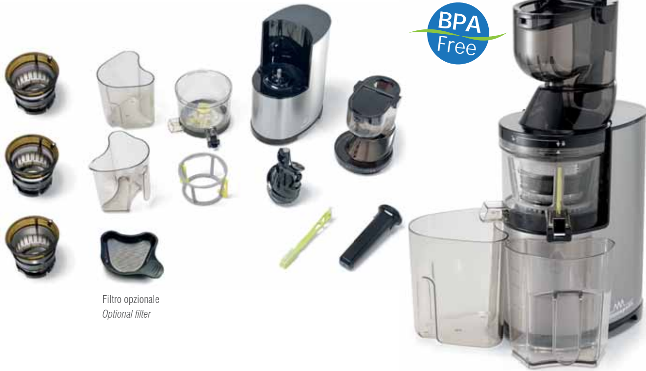
Filtro opzionale Optional filter