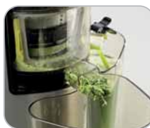
Vaschetta per gli scarti Tray for waste