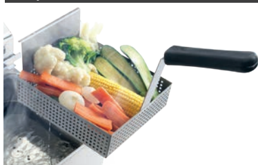
Cestello per cottura a vapore Steam cooking basket mm 200x220 h.60