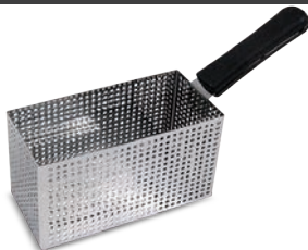
Cestello maxi: di serie per mod. 10 / opzionale per mod. 8 Maxi basket: standard for mod. 10 / optional for mod. 8