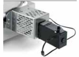
Tagliapasta Pasta cutter