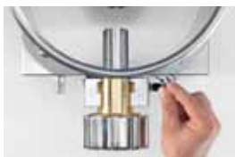
Chiusura bocca per impasto Gate closure for mixing