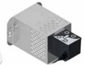
Tagliapasta automatico Automatic pasta cutter